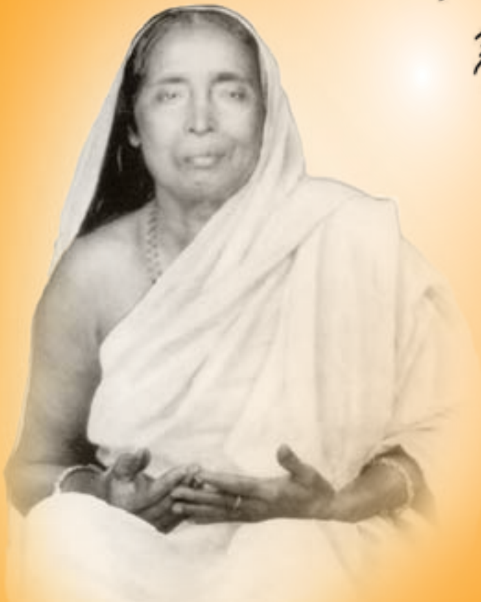
Madre Sri Sarada Devi 1853-1920

¡Eres Tú nuestra Reina del corazón, MA Argentina! ¡Gloria a Ti, oh querida eterna! Te amamos Madre Argentina. El cóndor vuela en la alta cordillera; flamea la celeste y blanca; nuestra tierra, mar, montaña, beneméritos ínsulas. ¡Eres Tú nuestra Reina del corazón, MA Argentina! Nuestro gaucho, kolla, inmigrante, mapuche, indígena, de tantas religiones, tantas personas, orgullosos, todos somos hermanos y hermanas. ¡Eres Tú nuestra Reina del corazón, MA Argentina!